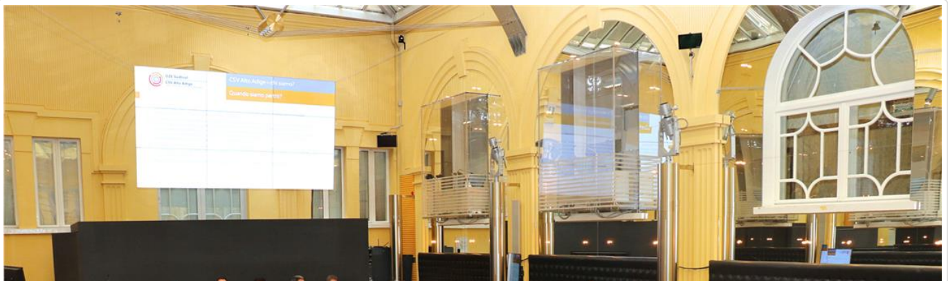
Presentazione del Centro servizi per il volontariato a Palazzo Widmann