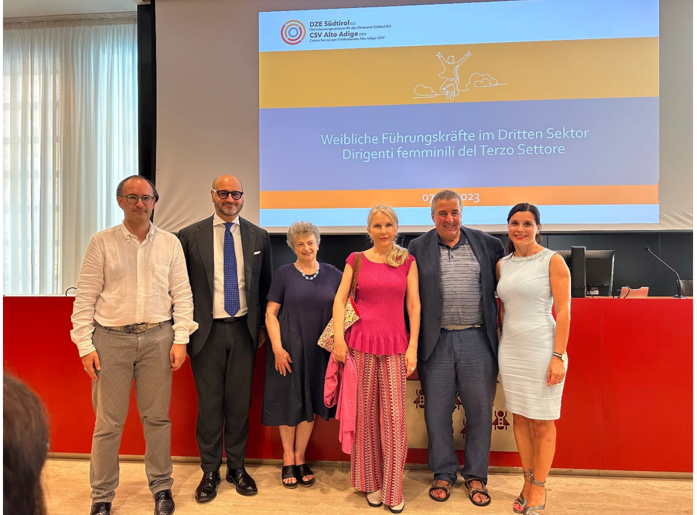
Due immagini del corso per dirigenti femminili del Terzo settore