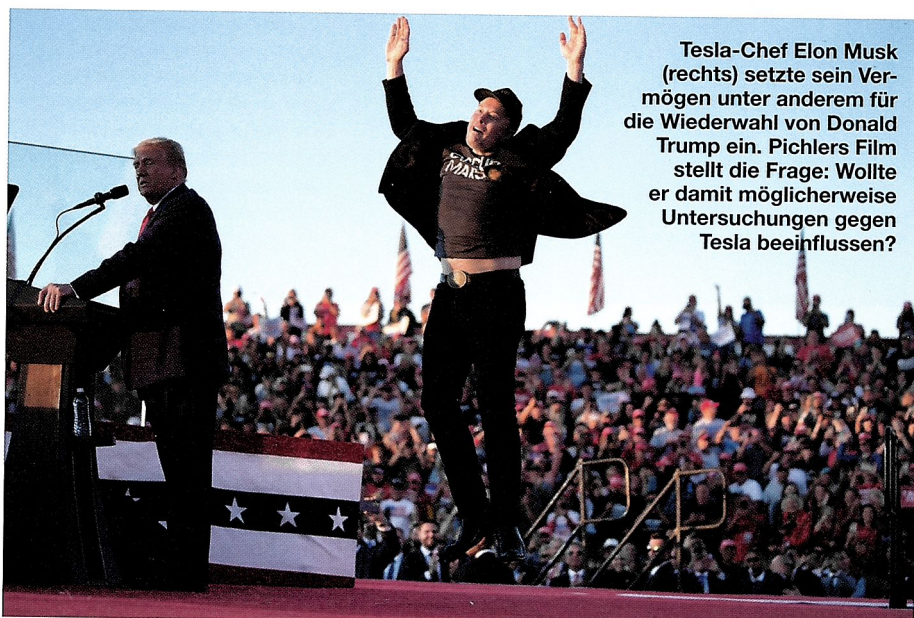
Tesla-Chef Elon Musk (rechts) setzte sein Vermögen unter anderem für die Wiederwahl von Donald Trump ein. Pichlers Film stellt die Frage: Wollte er damit möglicherweise Untersuchungen gegen Tesla beeinflussen?

Die Familie der verunglückten Frau hat Tesla verklagt und im Sommer Recht bekommen. Was bedeutet das Urteil?